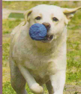
HOND EN BAASJE TE DIK? SPORT SAMEN MET JE VIERVOETER