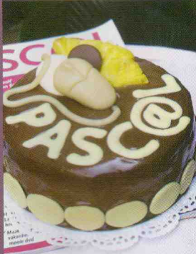
ER IS ER EÉN JARIG, HOERA, HOERA