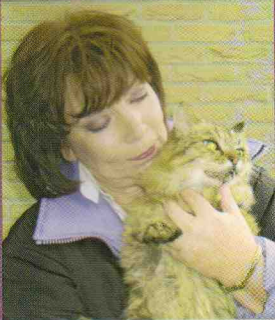
SONNY: 'DEZE KATTEN VERDIENEN EEN FIJNE THUIS'